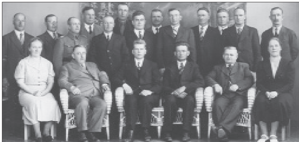
Sakkolan kunnanvaltuusto 1939.